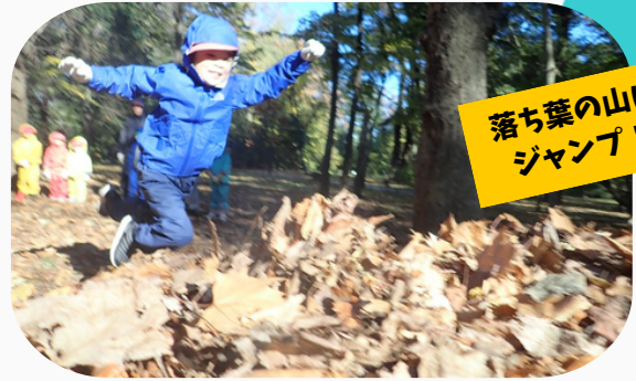
落ち葉の山にジャンプ！