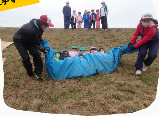
大人気！土手すべり